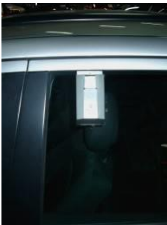
Kuva 2. Esimerkki ajoneuvon sivuikkunaan kiinnitettävästä avainsäilöstä

Avaimia voidaan myös säilyttää erillisessä lukittavassa ajoneuvon sivuikkunaan kiinnitettävässä avainsäilössä (ks. kuva 2).