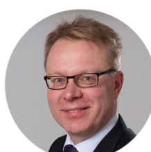
Petri Mero Finanssiala ry